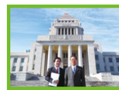
平成25年7月～平成26年11月

デリバティブで海外の金融機関と取引をする部署です。トレーダーとして為替先物・JGB先物・金利スワップ・通貨スワップ・オプション等を用いて、稼ぐ間も借しみなから、海外の銀行や証券会社と厳しい取引を行っていました。