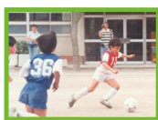
平成2年4月～平成8年3月

維新は大阪では、自民党をはるかに超える圧倒的な支持を得ています。それは維新の改革により、実際に街が良くなったからに他なりません。維新という大阪の政党ではないのか、そう思っている方も多いかもしれませんが。しかし決してそうではありません。「大阪で成功した改革を全国で行っていく。」それが私たち日本維新の会の理念です。