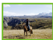
平成15年4月～平成20年3月

校則の厳しい学校で当時はその厳しさに悩んでいましたが、そのおかげで自分の中で一本の筋を通すことができました。勉強もスポーツも忍も全力でした!