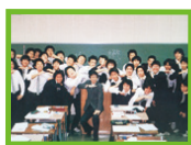
平成8年4月～平成14年3月