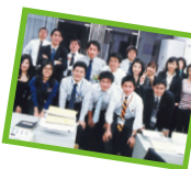
平成20年4月～平成22年6月

旅とテニスに明け暮れた日々。机の上では学ぶことのできない、多くを学びました。写真は中国の奥地・新疆ウイグル自治区を馬で旅した時のものです!